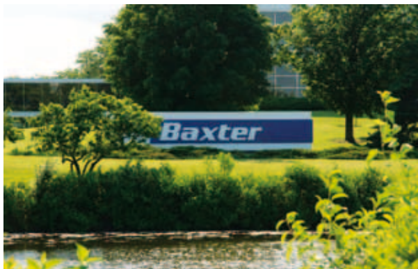
Oficinas centrales de Baxter en Deerfield, Illinois, Estados Unidos.

Baxter considera la sostenibilidad como un enfoque estratégico a largo plazo para incluir aspectos sociales, económicos y medioambientales en nuestros objetivos comerciales. Los resultados de sostenibilidad de la compañía respaldan la misión de Baxter de aplicar las innovaciones científicas para desarrollar productos y terapias que salvan y mantienen vidas.